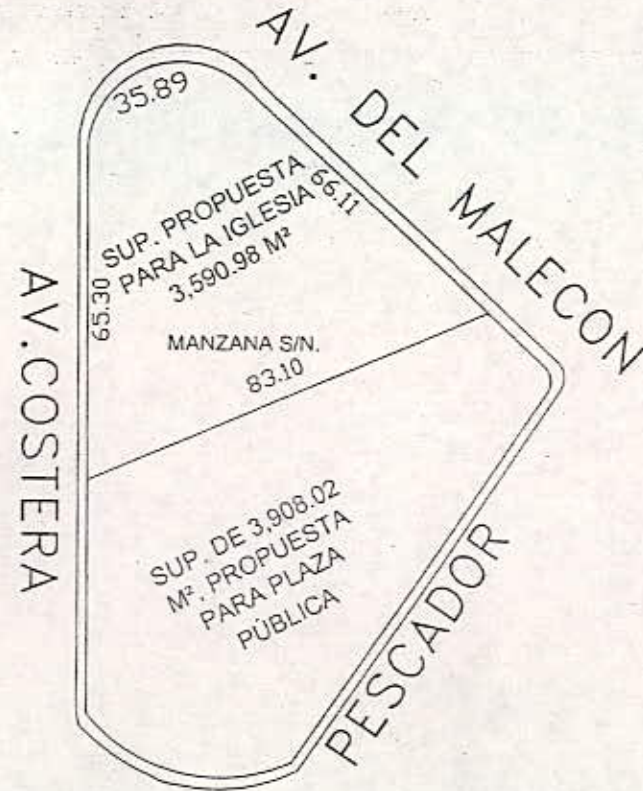
CROQUIS DEL PREDIO S/E.

LA FRACCIÓN DE LA MANZANA SIN NUMERO DE ÁREA DE CESIÓN MUNICIPAL, PROPUESTA EN DONACIÓN A LA DIOCESIS DE TORREÓN A.R. CUENTA CON UNA SUPERFICIE DE 3,590.98 M 2 Y CUENTA CON LAS SIGUIENTES MEDIDAS Y COLINDANCIAS: AL NORTE: EN LINEA CURVA EN 35.89 METROS CON AV. DEL MALECON Y AV. COSTERA. AL NOR ORIENTE: EN 66.11 METROS CON AV. DEL MALECON. AL ORIENTE: EN 65.30 METROS CON AV. COSTERA. AL SUR ORIENTE: EN 83.10 METROS CON FRACCIÓN DE TERRENO DE LA MISMA MANZANA DESTINADA A PLAZA Y ÁREAS VERDES PÚBLICAS.